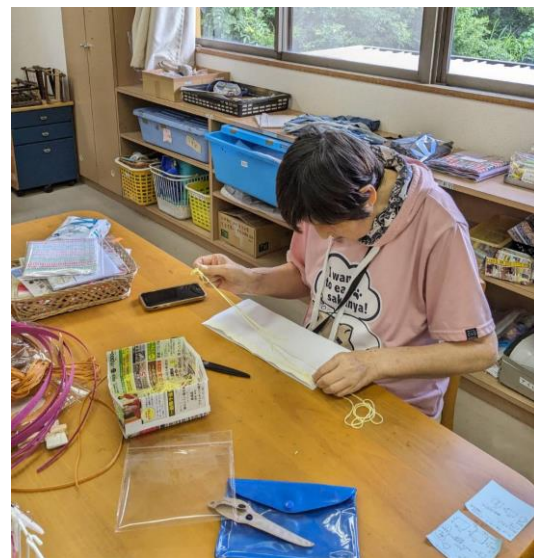
ミシンを使えるMさんは手芸が得意！

食材班は週3回 オープンハウスむつごろうの食材購入、仕分け、配達、週末の弁当手配をしてくださっています。メニューに応じて冬は刺身、夏はうなぎなど利用者の方の健康と栄養バランス、季節の楽しみを考慮して提供させていただきます。いつも感謝です。