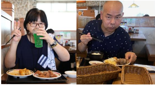
あ〜メロンソーダ美味しいな〜。まだまだ食べるぞ！