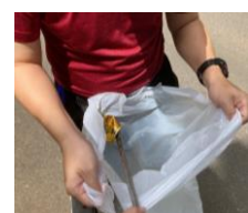
缶や可燃ゴミ。ちりも積もれば・・・