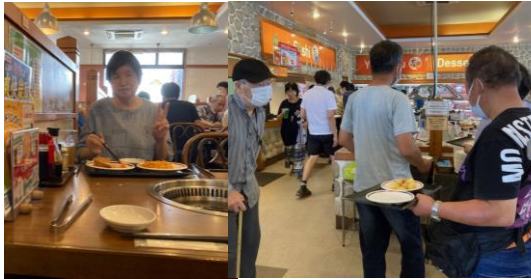
4年ぶり！！みんなと食事は楽しいな ♪

今年は4年振りに合同レクレーションで「スタミナ太郎」に食べに行きました！コロナ禍で外出ができなかったこともあり、皆さんとても満足されていました。お肉に、お寿司、ラーメン、うどん、アイスなどのデザートもお腹いっぱい満たして、各テーブルにはお皿がいっぱいでした！