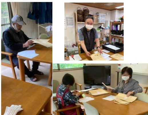
広報誌の封入作業風景