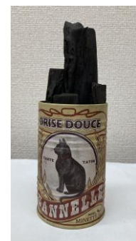
消臭効果のある炭