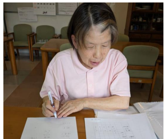
メニューに対する食材内訳を作成中です。