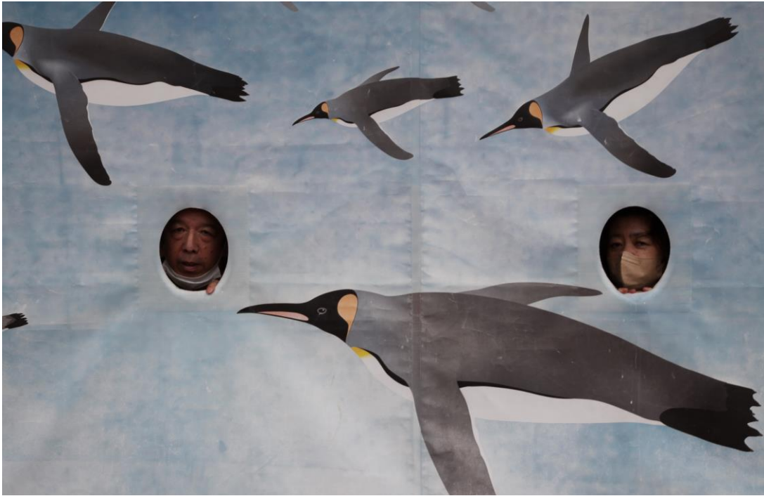
一年ぶりに再会したペンギン達、相変わらず元気でよかった。幸せなひとときを、ありがとう！来年もまた来ます！