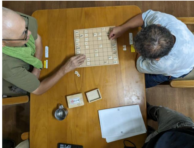
夕食後の日課。Yさんの将棋、この日はUさんと勝負！