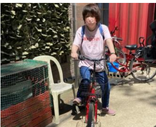
野岳サイクリング