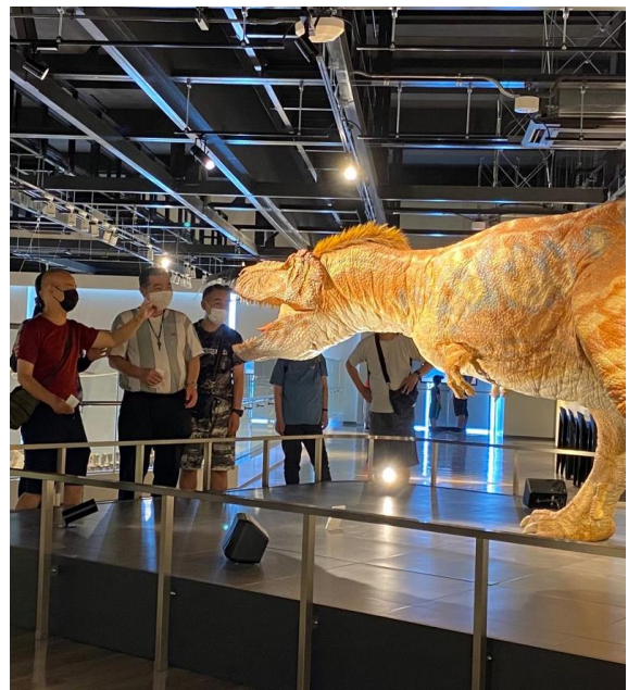
迫力があって、皆さん興味津々です！