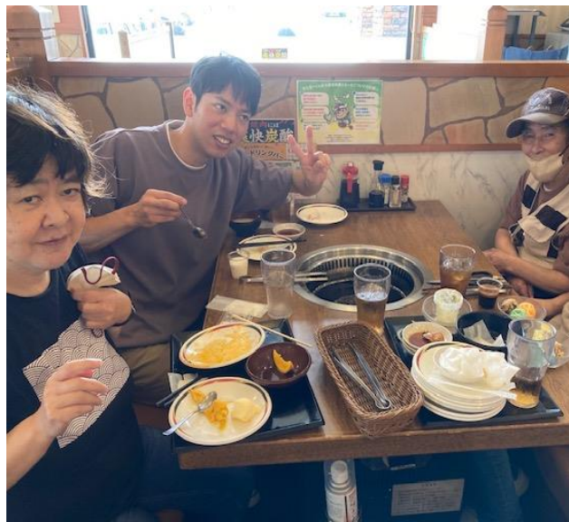
おやつ制限もこの日は特別！明日からまた、頑張ります！