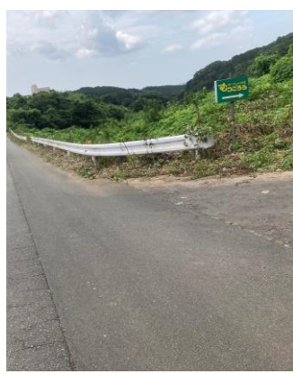
この日は農道沿いを。少しスッキリ！暑い夏。今後も続きます！！

本野町にあるグループホームでは施設周辺を散歩するようになっています。散歩中に空き缶や「ゴミ」を目にしたり、「ごみ」指摘を受けることもあり、散歩中にゴミ拾いを始めるようにしました。また、市民大清掃の日に参加ができないこともあり、定期的に施設周辺の草刈りをさせていたで、地域のお役に立てればと思っております