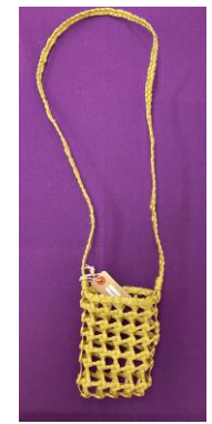
クラフトポシェット