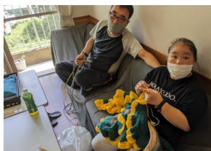
Wさんは得意の編み物で大作を作成中！

決まった作業だけではなく、得意なことを生かして、物作りをしていただくこともあります。得意なことだと集中力もアップするんです。