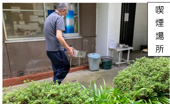
喫 煙 場 所