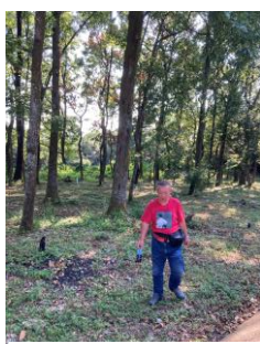
いざ、昆虫採集へ！ ↓ 沢山採れた！！